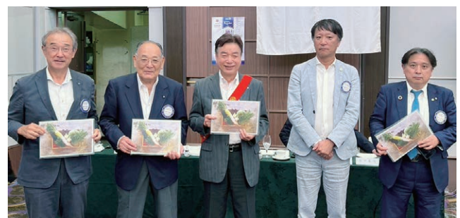
10月度お誕生日祝い