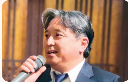
紙谷会長エレクトの 中締めご挨拶 「次年度は45周年です、 ロータリーは永遠に不滅です！」