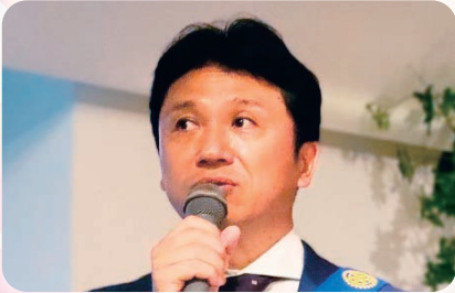
堀 クラブ奉仕担当理事 兼 親睦活動委員長 「本日の移動家族例会 ありがとうございます。」