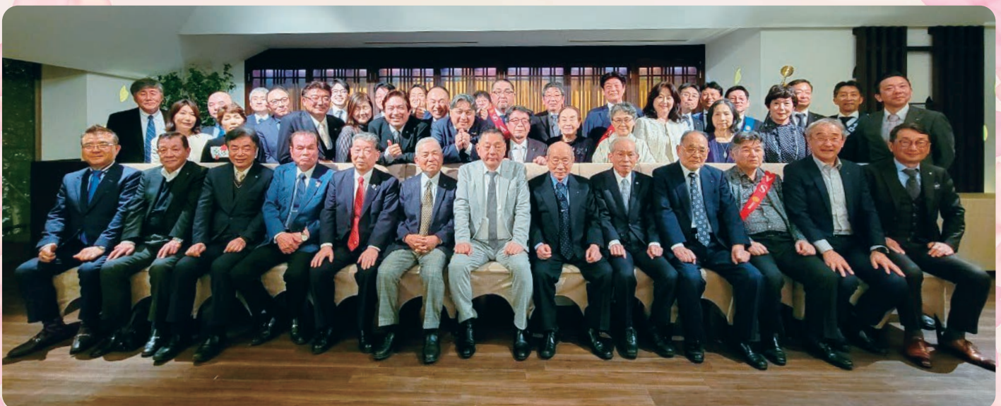
2023-24年度 春の移動家族例会 (2024.4.8 京都 桜鶴苑にて)