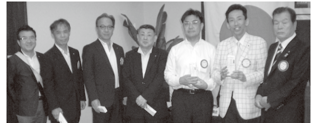
皆出席お祝い記念品贈呈