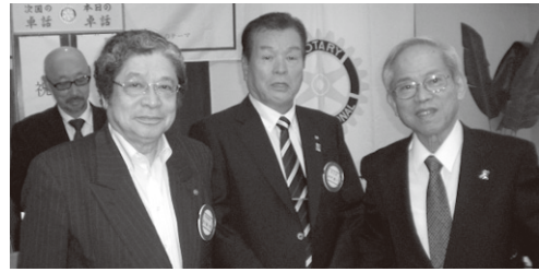
ロータリー財団 マルチプルフェロー表彰

地区とクラブ、IM2組の12クラブの関係も、互いの独自性を尊重しながら仲よくなれるよう、微力ですがカバナー補佐として務めを果たして行きたいと思っていますので、吹田西ロータリークラブの皆様のお一層のご協力をお願い致しまして、ご挨拶とさせていただきます、一年間、よろしくお祈り致します。