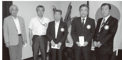
ホームクラブ出席100% お祝い記念品贈呈