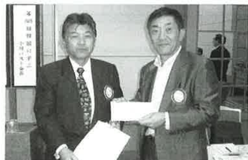
CCRCよりの東日本大震災義援金授受