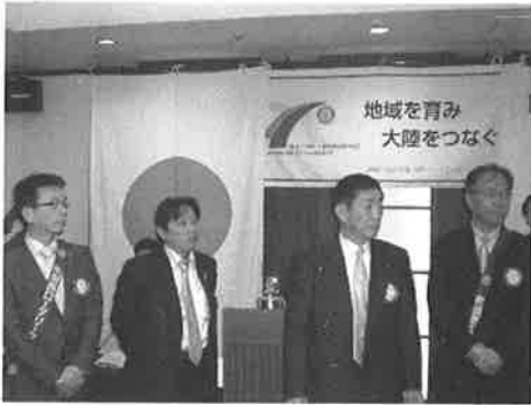
タイ・ナコンパノムRC訪問 代表団 結団式