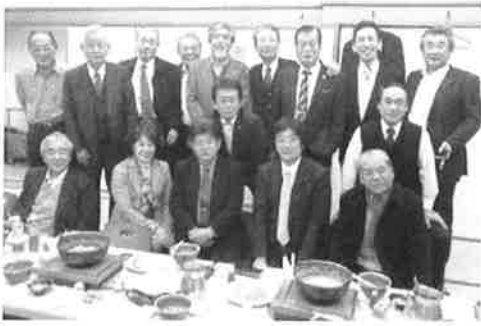
2月18日(金) 国際奉仕担当 炉辺談話