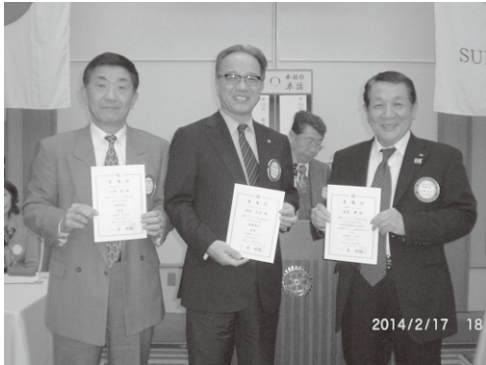
次年度地区委員に委嘱状