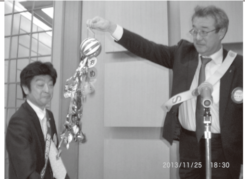
11月目標達成記念のくす玉割り