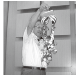
7月目標達成記念の くず玉割り